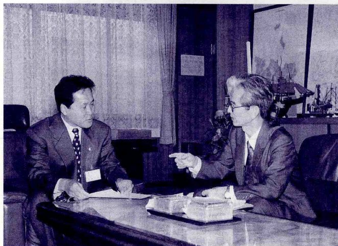
(市長へ申し入れする会長)

市長 15年以上もの昔は用地提供程度で大学病院を誘致できました。しかし、近年は診療報酬の抑制や薬価基準の引き下げなど、病院経営も厳しく、どの自治体も救急医療や開設費の一部を負担しているのが現状です。昔とは誘致の条件が違います。昨年合意された