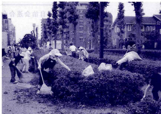
ゆりのき台自治会連合会(9自治会、千200世帯)は、街づくりの

今年から八千代市ではアダプト制度を採用することになりましたが、現在の私共の共同作業が「先駆け」となったのかな」と自画自讃しております。