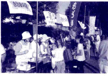
手作り園遊会 (米本南自治会)