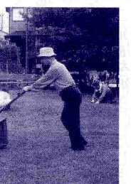
一回、午前中の三時間途中にティータイムを設け、お茶と茶菓子が供されます。

よく整備された公園には幼児連れや学童がよく遊びに来るようになりました。異世代交流が自然な形で行なわれています。