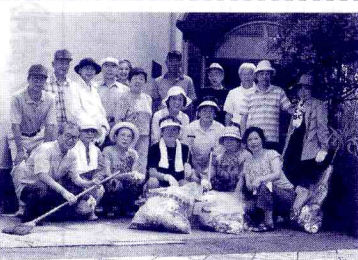
このような地道な活動であります。多年にわたる地域の貢献が評価され、千葉県道路協会長より、また、八千代市自治会連合会長の表彰を受け大きな励みになっております。参加者の高齢化が今後の課題となっておりますが、これからも駅前通りの美化運動とごみの減量化をめざして、微力ながら地域の貢献に当たる所存です。

て商店であり、駅前商店街を形成しています。駅前には、朝夕の通勤者、学生、買い物客などが、安全かつ気持ちよく利用してもらえ場所をなければなりません。加えて地域貢献の趣旨から、自治会設立とともに始めた事業が駅前および周辺道路の一斉清掃でした。毎月第三日曜日の朝九時を定例とし、約三十名が自主的に参加、拾い集めたごみをもえ