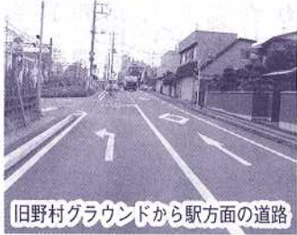
旧野村グラウンドから駅方面の道路

(3)は、担当課において改善するとの事。(4)は、市において、既に計画立案し予算化もしてあるので21年度中には着工し、完了出来るとの事。当日会場では次のよ