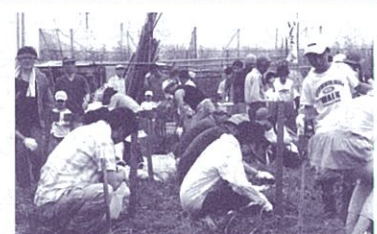
盛況な「ジャガイモ掘り会」

村上団地自治会の活動(紹介) 村上団地自治会は、4自治会約1,900世帯で構成されています。この自治会の活動のモットーは、会員同志のコミュニケーションづくりを最大とし、災害、防犯事故などの防止に役立てています。近年識者の言う「防災訓練も良いが、むしろ自治会活動によるコミュニケーション」の方が時に役立つ」の実践と考えて